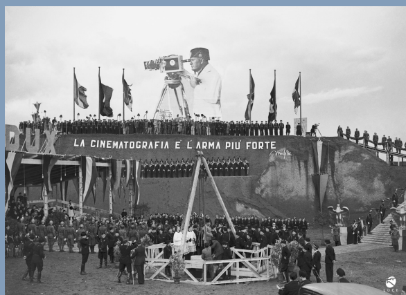
Ceremonia de apertura de Cinecittà. Roma, julio de 1936