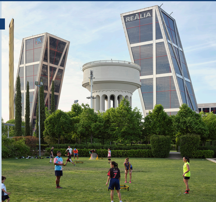
Districto Chamartín. Juego Roundnet. Parque del cuarto depósito.