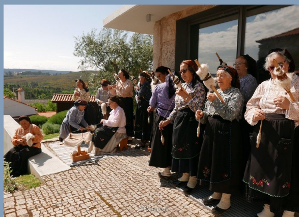
Red Tramontana III, 2018.