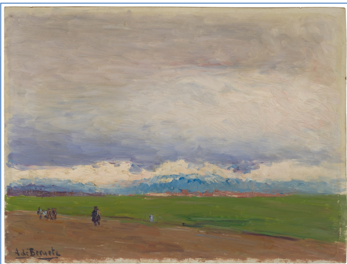
Paisaje de Castilla, Aureliano de Beruete. Hacia 1907

Se emitirán certificados para los participantes exclusivamente cuando esté confirmada una asistencia de un mínimo del 80 % del seminario.