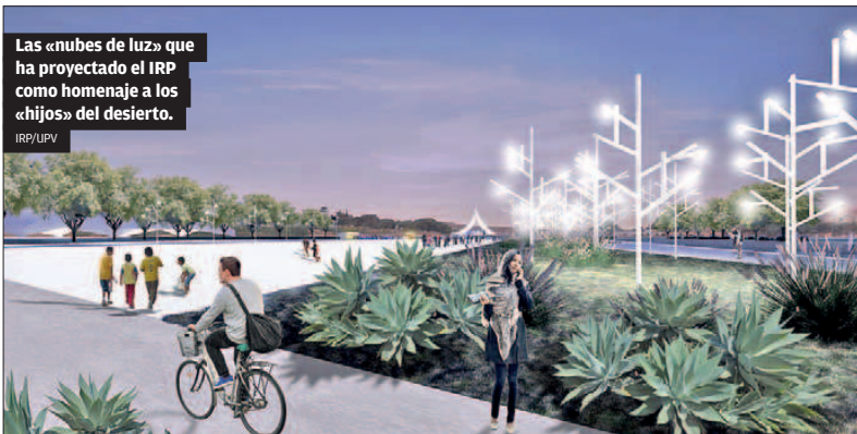
Las «nubes de luz» que ha proyectado el IRP como homenaje a los «hijos» del desierto.