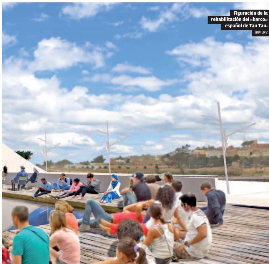
Figuración de la rehabilitación del «barco» español de Tan Tan.